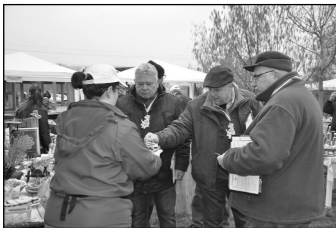
A zsűri eszik

Míg a többi csapat a boraikat és a pálinkáikat helyezte előtérbe, addig mi egy házi készítésű fenyő szörppel vettük le őket a lábukról (természetesen pálinkánk is volt, de azt már nem kívánta a zsűri).